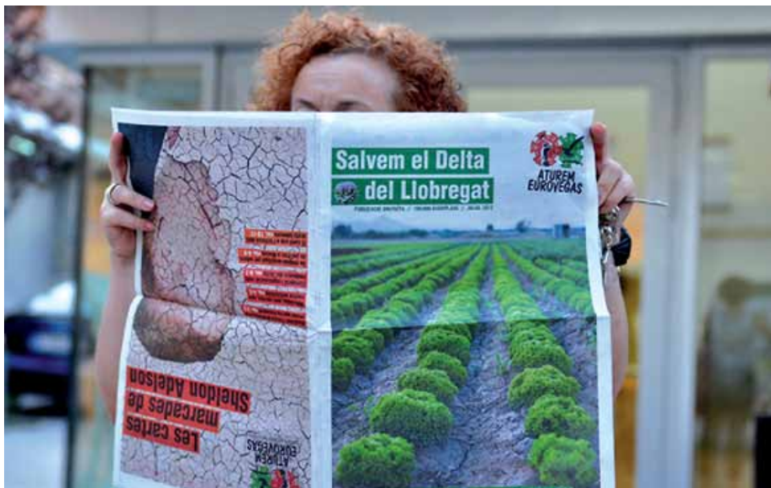
ARXIU PLATAFORMA ATUREM EUROVEGAS

En pocs mesos, la Plataforma ha realitzat xerrades i debats, bicicletades i marxes, manifestacions brandant carxofes com la que es va fer a la plaça Sant Jaume el passat 17 de juny, protestes davant la visita de la delegació de l'empresa Las Vegas Sands als terrenys del Baix Llobregat, etc. L'activitat de la Plataforma havia de culminar amb un gran concert gratuït, el