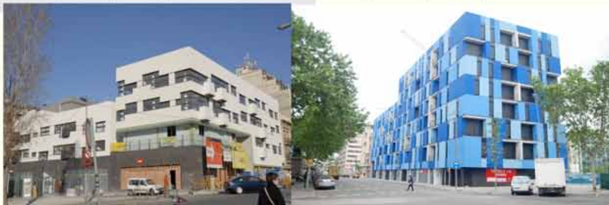
Vallespir 30 (Barcelona)