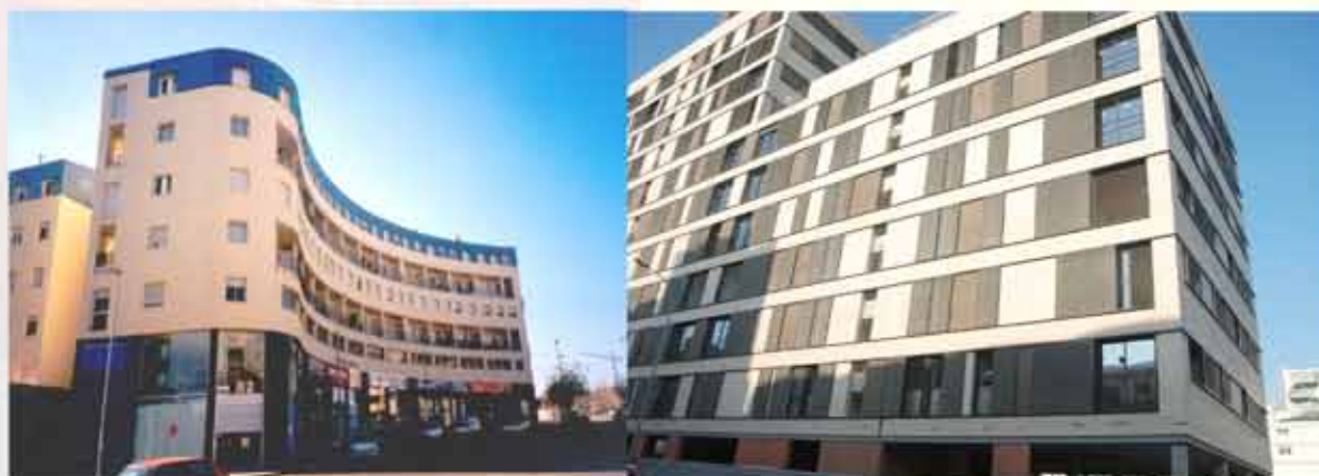
Plaça del Vi (Martorell)

Les Cooperatives Veïnals de Barcelona han entrat al segle XXI adaptant-se el millor possible per aconseguir promocionar edificis singulars i moderns dins les seves possibilitats.. Amb els recursos limitats dels que es disposen, les Cooperatives han fet un esforç per donar personalitat als seus edificis i adaptar-los a la llei d'ecoeficiència, optimitzant els recursos sostenibles. A continuació us mostrem varies promocions de Cooperatives Veïnals que ha gestionat Sogeur els últims anys: